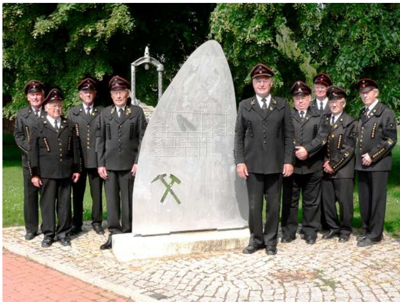
Der Vorstand vor dem Erinnerungsmal Normannische Straße

Die Vereinsmitglieder pflegen weiterhin die Tradition des Bergmannsberufes.